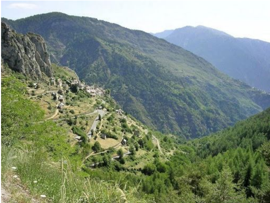
Montée du Col de la Couillole, 1678 mètres d'altitude