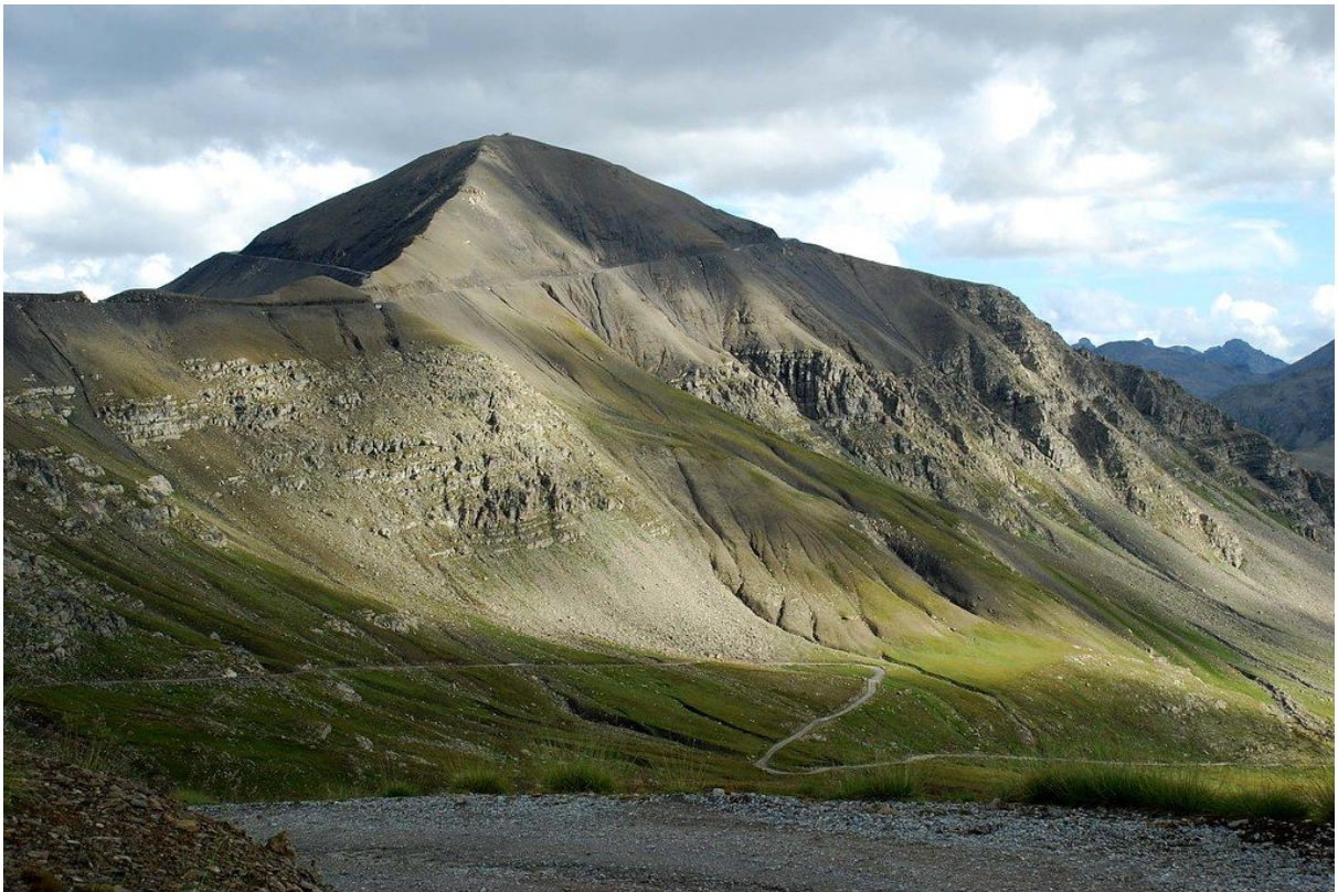
Cime de la Bonette, 2802 mètres d'altitude