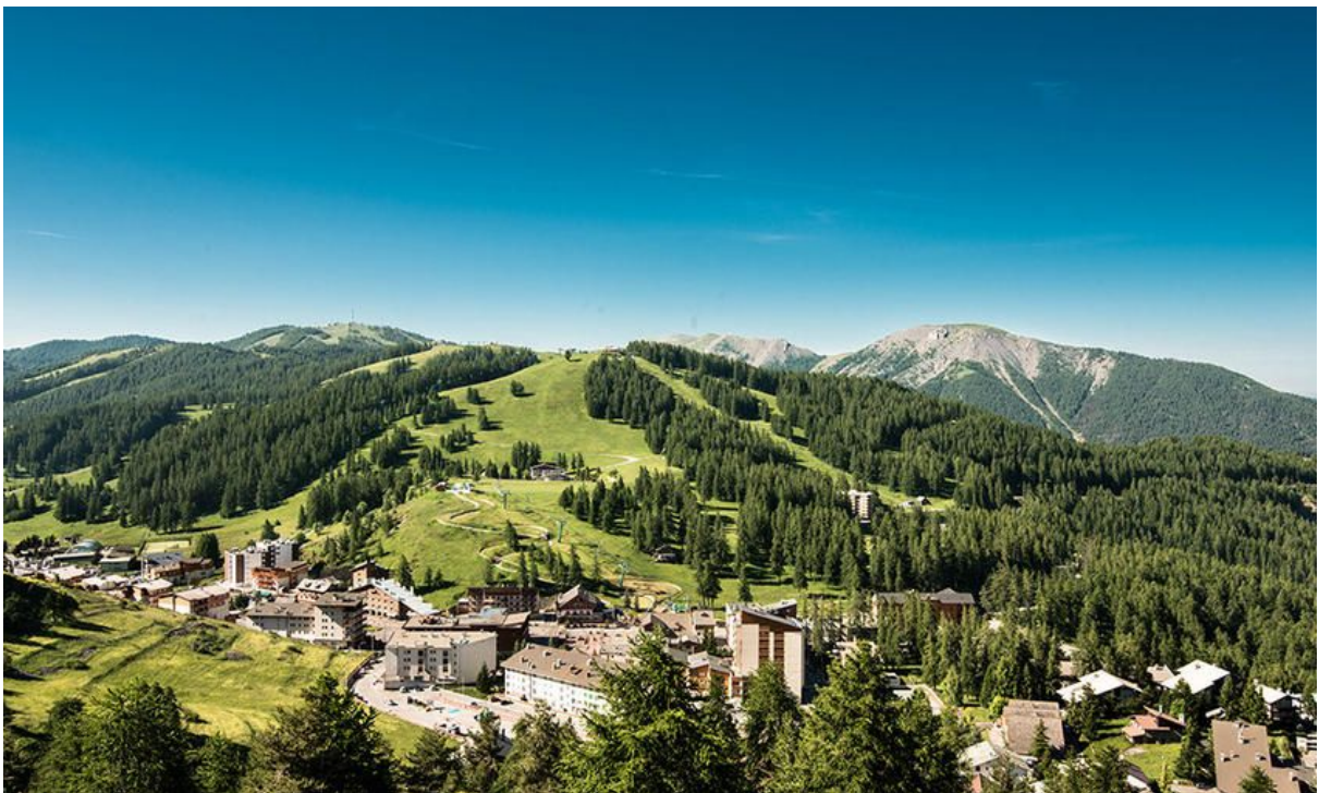
Valberg, station de montagne