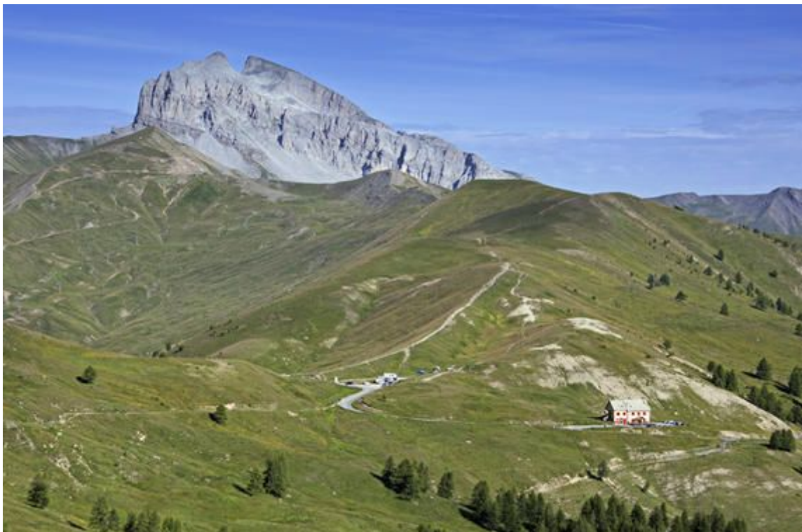
Col d'Allos, 2250 mètres d'altitude