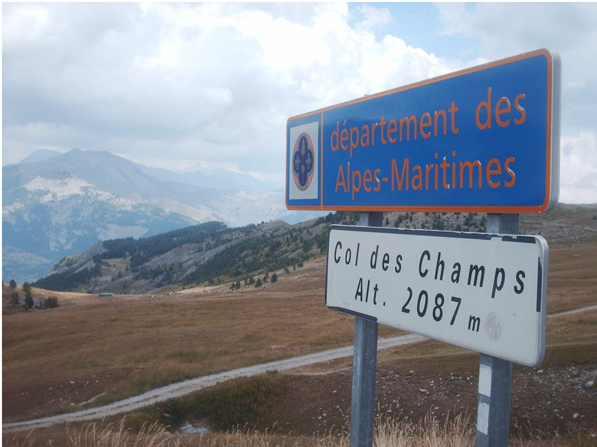
Col des Champs, 2087 mètres d'altitude